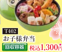
T402 お子様弁当 回収容器 税込1,300円