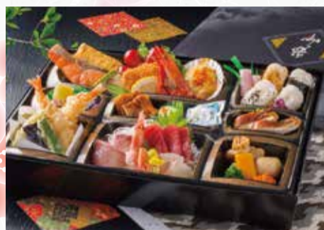
T104 刺身・天ぷら入り会席 税込4,000円