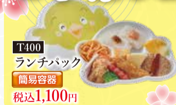
T400 ランチパック 簡易容器 税込1,100円