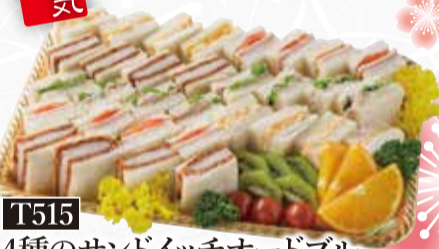
T515 人気 4種のサンドイッチオードブル 税込4,000円