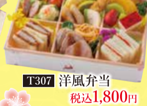
T307 洋風弁当 税込1,800円