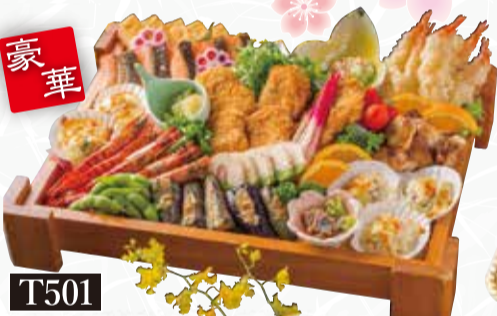
T501 豪華 むらかみオードブル (5人前) 税込7,000円