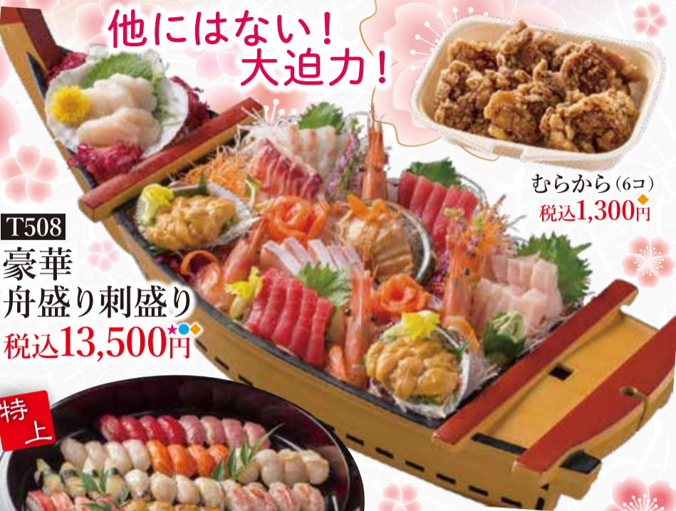
T508 豪華 舟盛り刺盛り 税込13,500円