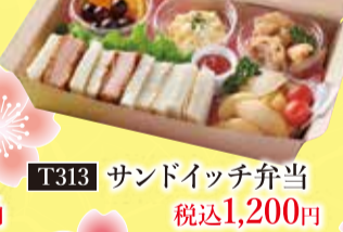
T313 サンドイッチ弁当 税込1,200円