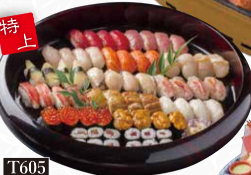
T605 むらかみ特上にぎり (4人前) 税込15,000円