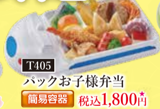
T405 バックお子様弁当 簡易容器 税込1,800円