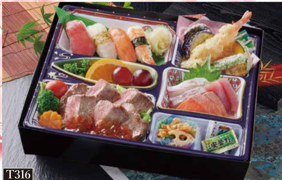
T316 やわらか牛ステーキ寿司膳 税込3,000円