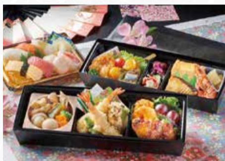
T3040 二段弁当 菖蒲(あやめ) 寿司版 税込3,500円