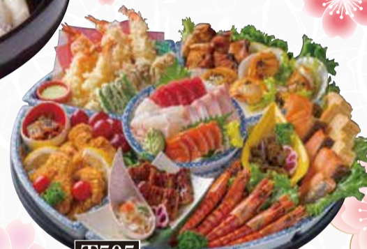
T505 刺身入り回転オードブル (5人前) 税込15,000円