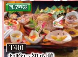
T401 お喰い初め膳 税込6,800円