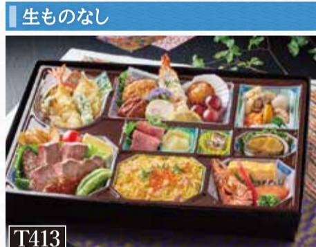
T413 あわび牛ローストビーフ・ステーキ入り会席 税込4,500円